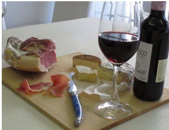
ワインと自家製生ハム 自家製チーズ