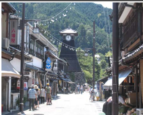
出石の街並みから望む辰鼓楼