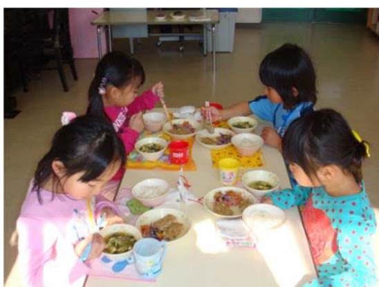
地元食材を使用した給食を食べる園児