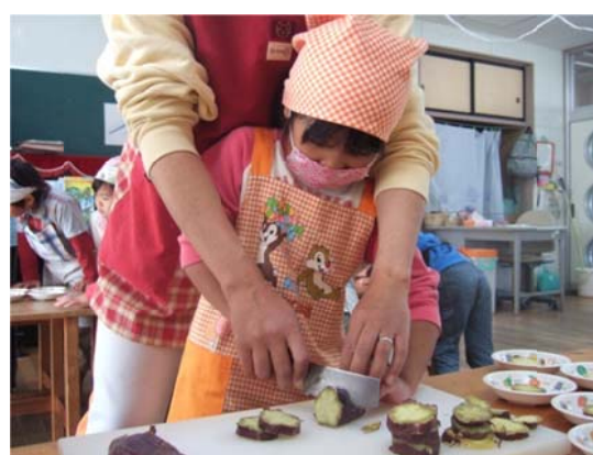
収穫体験したさつまいもを調理