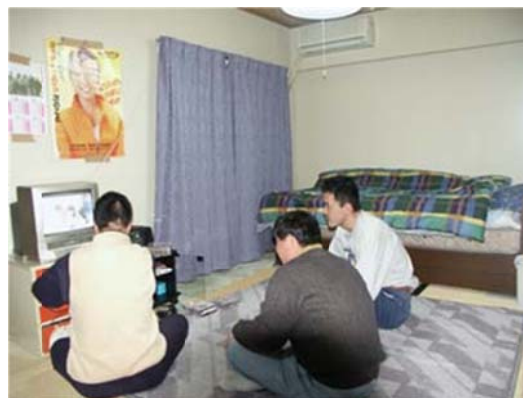
事務所（共同生活住居）内での交流