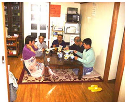
事務所（共同生活住居）内での食事