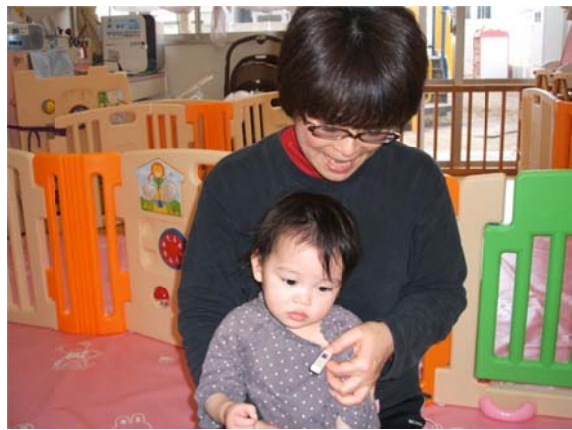
入所児童の健康管理を行う看護師