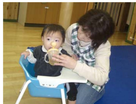
園児の体調管理と定期的な水分補給