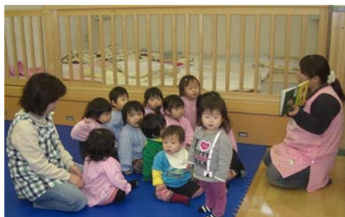
園児への絵本の読み聞かせ