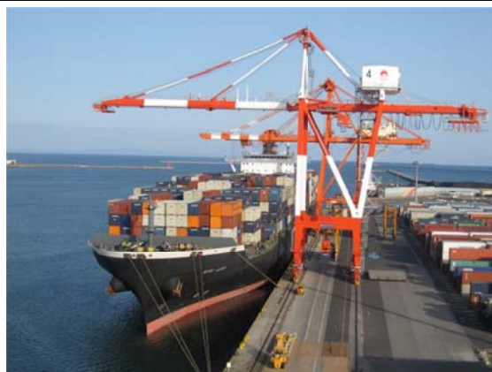
コンテナ船の荷役風景