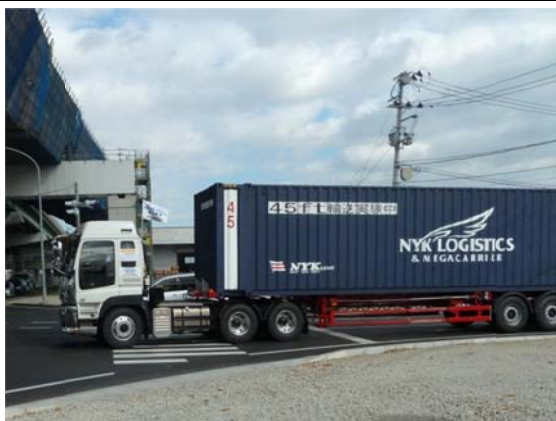
45フィートコンテナの輸送 (実証実験)