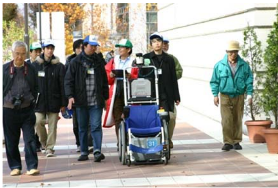
つくばチャレンジ 2010 の様子