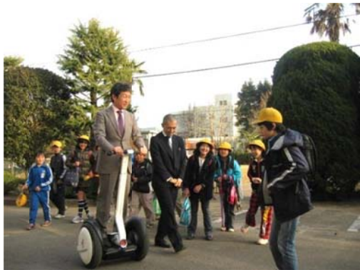
搭乗型移動支援ロボットの走行の様子