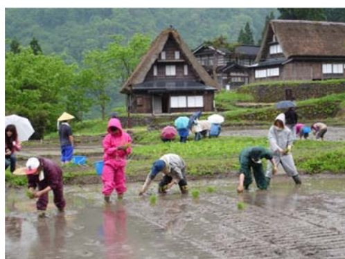
「みんなで農作業の日」 in 五箇山