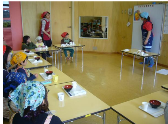
お菓子づくりの説明－食育