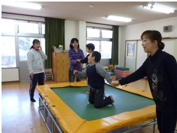
障害児への療育の様子