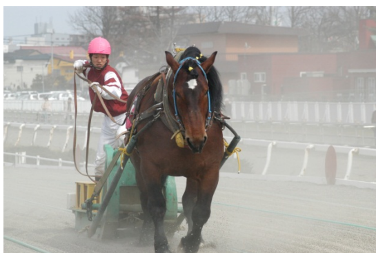
ばんえい競馬競走の様子 (帯広競馬場)