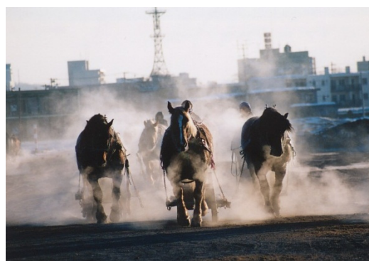
馬体から上る湯気が幻想的な冬の朝調教