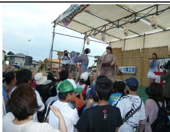
新たな魅力の創出による活力ある地域の形成