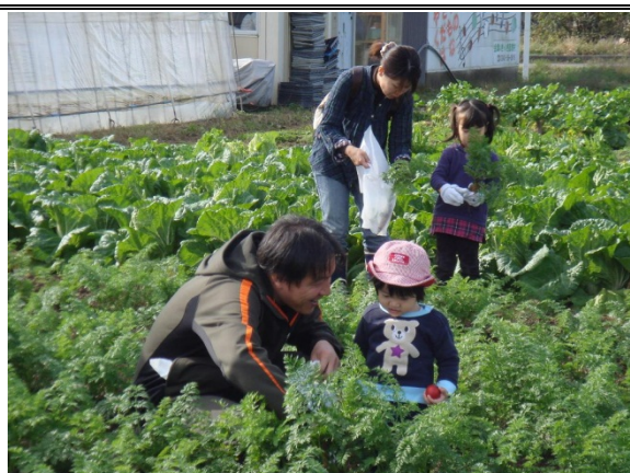
グリーンツーリズムによる都市農村交流の推進