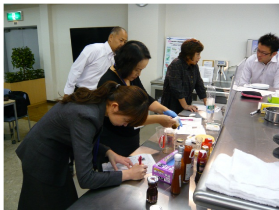
商品開発支援の様子