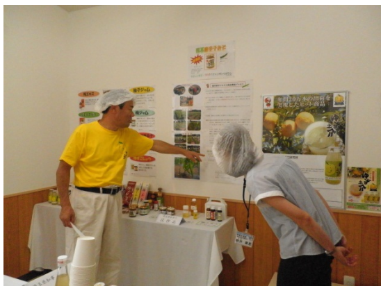
6次産業化の取組について説明を受ける 普及指導員