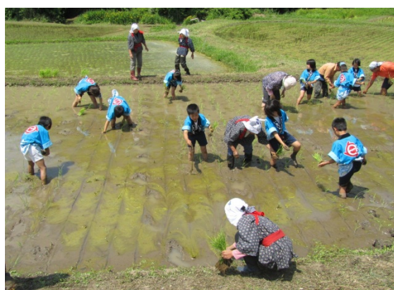
地元農業者の指導による田植え体験を通じて「地産地消」を学習