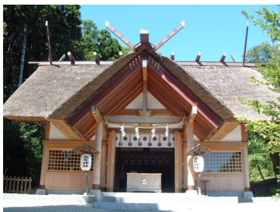
高家（たかべ）神社は日本唯一料理の祖神を祀っている