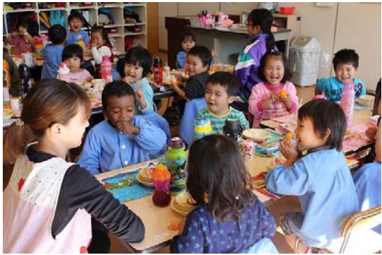
乳幼児を母のように見守る保育士