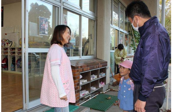
保護者との信頼関係を築きます