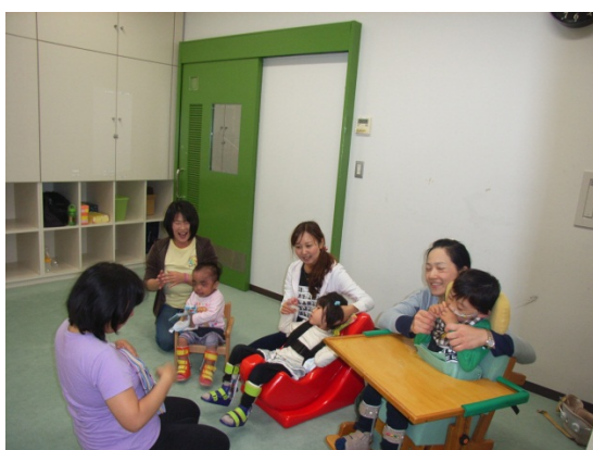
障害児への療育の様子（うた遊び）