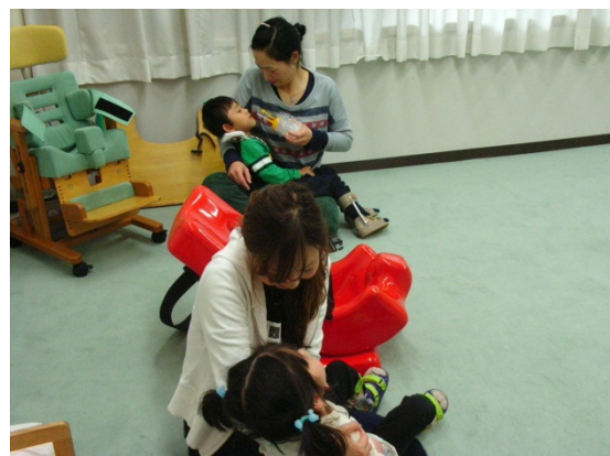
健康状態を観察しながらの水分摂取