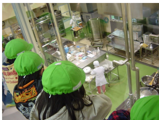
学校給食センター見学の様子