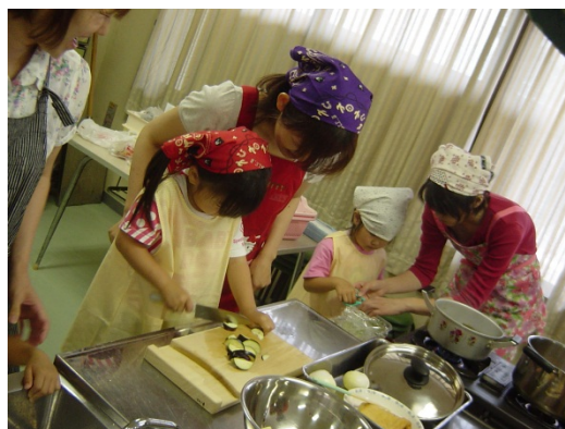
親子クッキングの様子