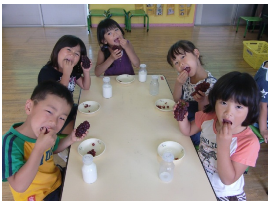
地元産「柏原ぶどう」のおやつ