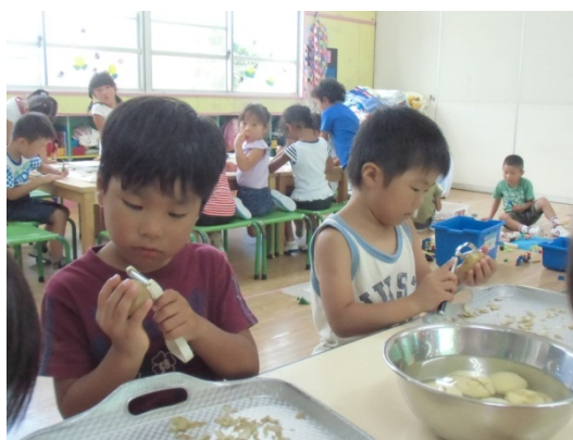
収穫のじゃがいもでクッキング