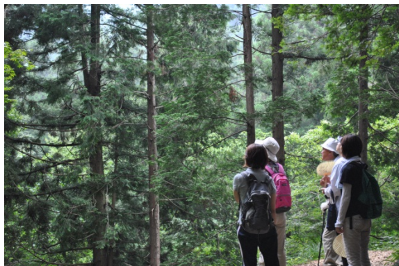
森林セラピーガイドとの散策の様子