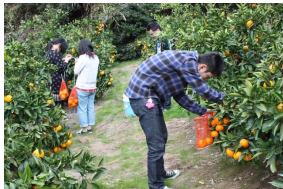
グリーンツーリズムにおける収穫体験