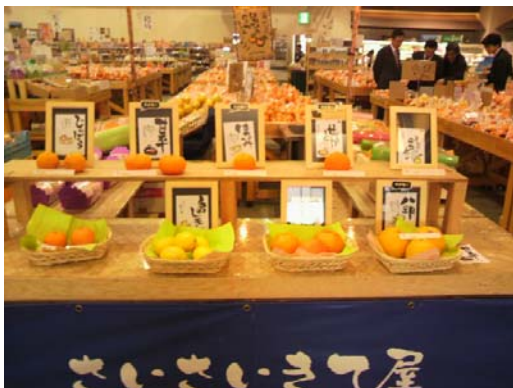
直販施設による地域特産物の販売風景