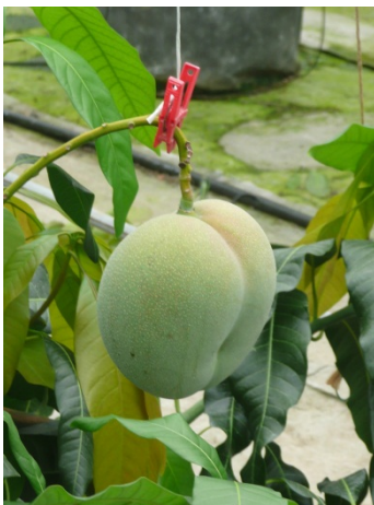
足摺完熟マンゴー（品種：キーツ）