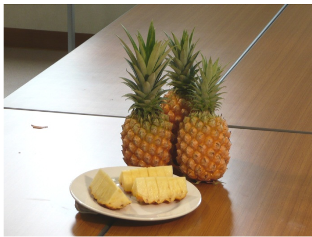
足摺芳香パイナップル