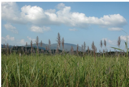
徳之島の基幹作物である「サトウキビ畑」