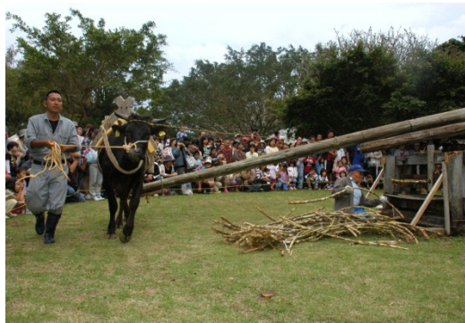
昔ながらの黒砂糖造りを再現して体験する祭り