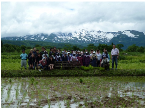
地元農家と県内大学生が農業体験 交流（田植え編）