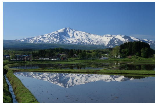
日本百名山の一つ「鳥海山」