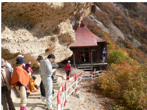
開湯伝説の地「地蔵倉」 縁結びのパワースポット