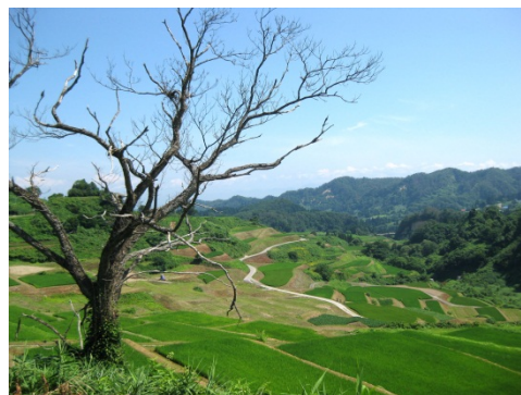
四季を通じて美しい風景を見せる 「四ヶ村の棚田」