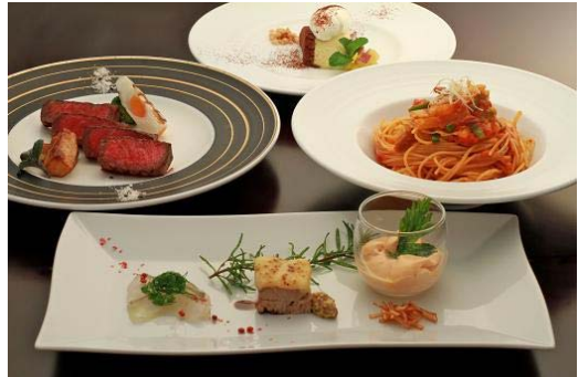
町が誇る「石見和牛肉」や減農薬野菜を使った地産地消レストラン素材香房 ajikura