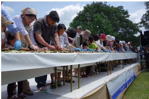
地域の「食材加工」の知恵を未来の子供たちへ 親子でロング巻きずしに挑戦 A級グルメ祭り

適用される規制の特例措置： 地域限定旅行業における旅行業務取扱管理者の要件緩和事業