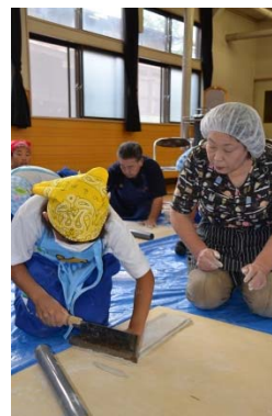
グリーンツーリズム