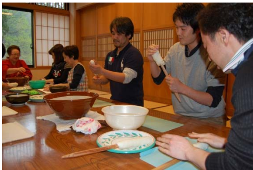
郷土料理きりたんぽ作りに挑戦