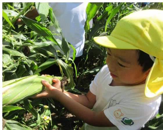
とうもろこし収穫の様子