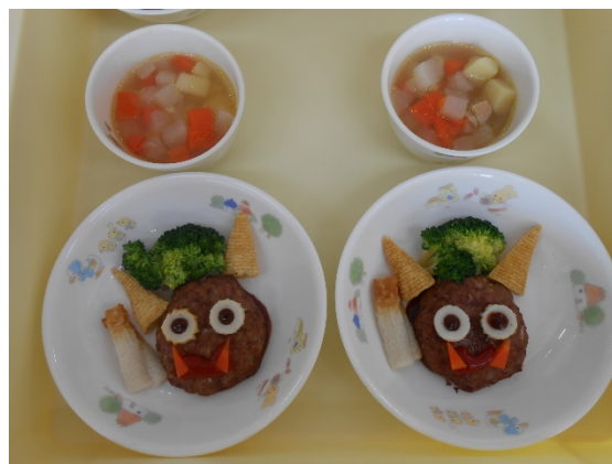
給食の一例（節分時の行事食）