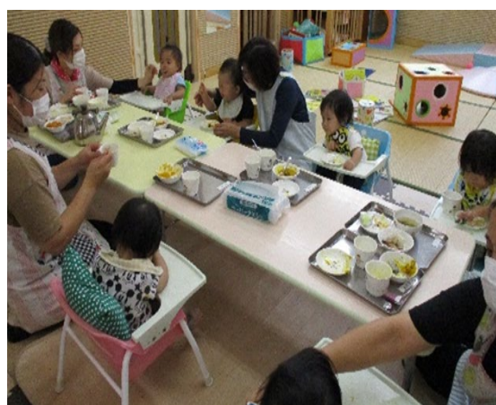
給食の様子（イメージ） （写真は同法人運営の認定こども園）