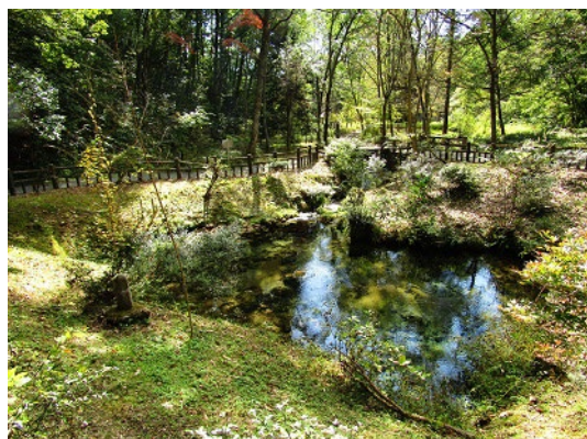
塩釜の冷泉 名水百選（環境省）