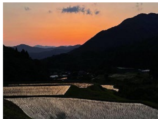
社の棚田 つなぐ棚田遺産（農水省）