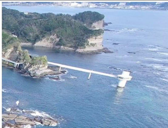
豊かな自然の恵みを活用した地場産業