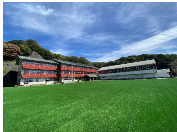
元小学校校舎を活用した広域通信制・単位制高等学校の設置