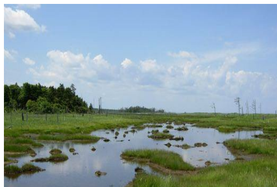
ラムサール条約登録湿地 「風連湖・春国岱」