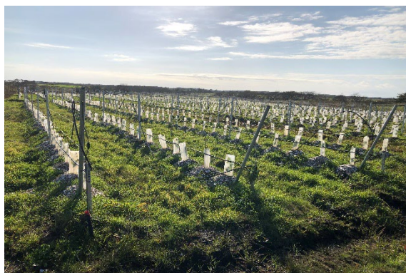
冷涼な気候を活かした果樹栽培 (ぶどう畑)