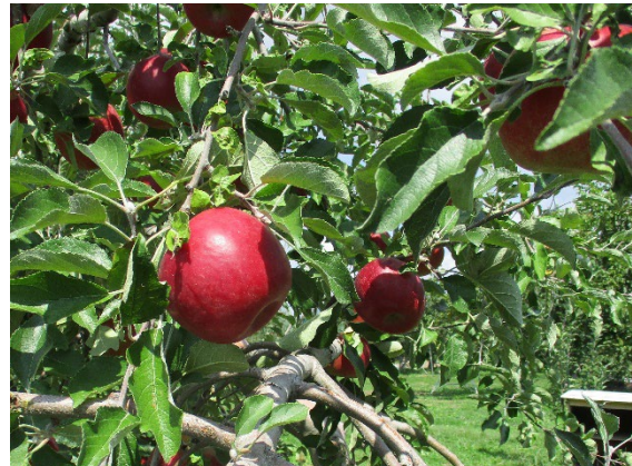
生産が盛んなりんご