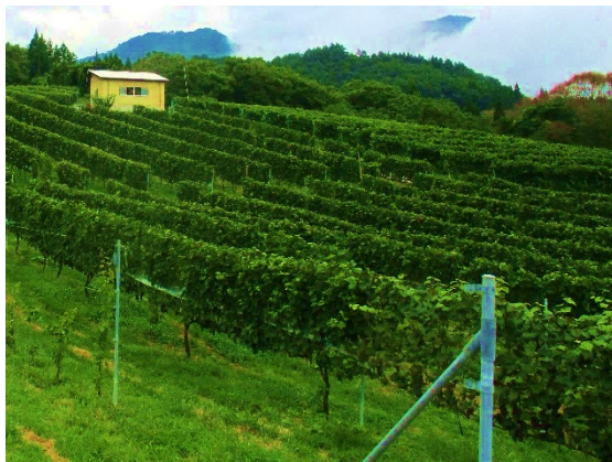
市内に広がるぶどう畑