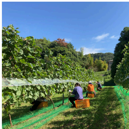
ぶどう畑・北淡路地区