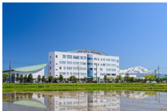
山形県立産業技術短期大学校庄内校