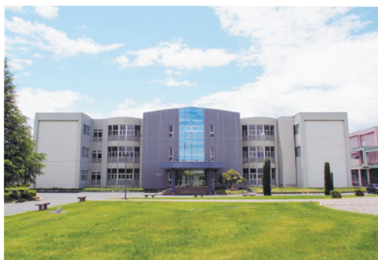
山形県立産業技術短期大学校