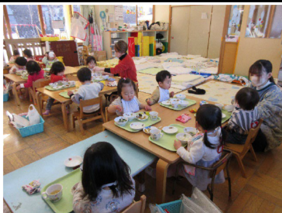
給食の様子（イメージ） （写真は搬出予定の保育園）