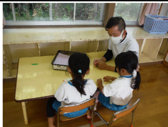
療育の様子（イメージ） （写真は公立の児童発達支援事業所）