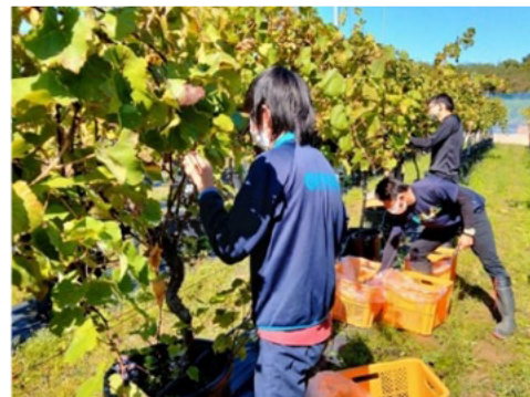
ワインぶどうの収穫の様子