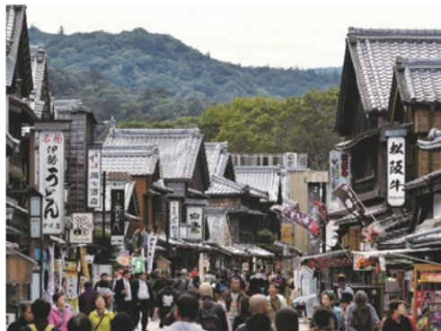
江戸時代の町並みを再現した おはらい町