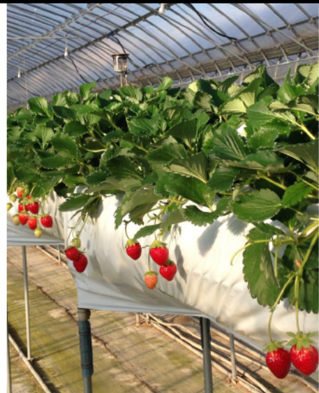
生産が盛ないちご・神戸市北区