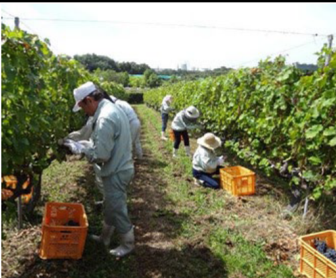
ワイン用ぶどう畑・神戸市西区