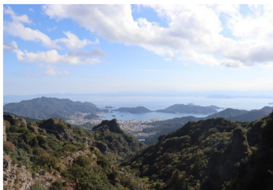
日本三大溪谷美 寒霞溪からの景観