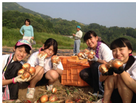
【農林漁業体験民宿】