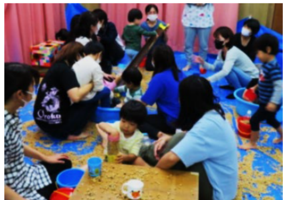
療育の様子（豆あそび）