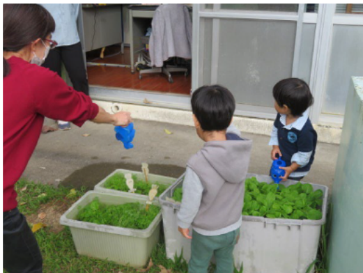
療育の様子（野菜の栽培）