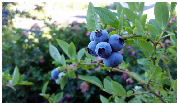
塩谷地区で栽培されている ブルーベリー