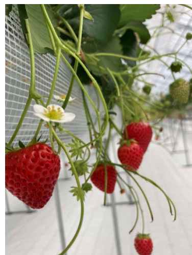
温室栽培施設で栽培されているいちご