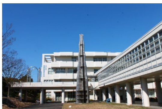
神奈川県立産業技術短期大学校