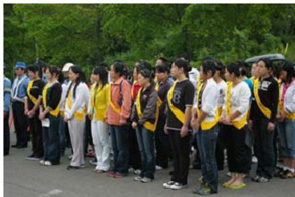
交通安全運動に地域と一体となって参加