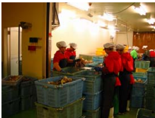
水産加工場で加工技術の修得を行う