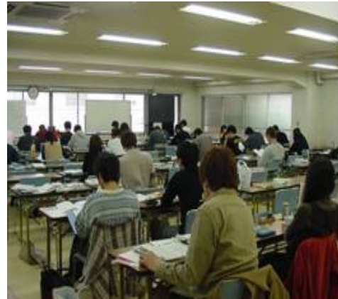
教室での授業の様子