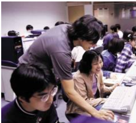
講師による専門的な指導を受ける学生