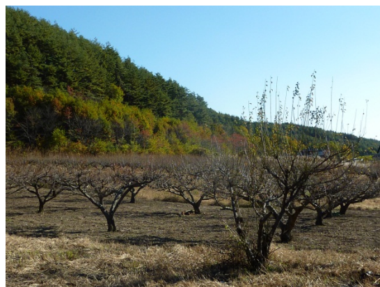
北杜市須玉町小倉地区のうめ畑