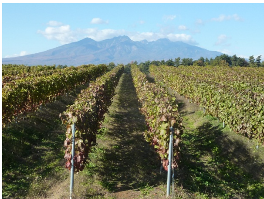
北杜市明野町に広がるぶどう畑