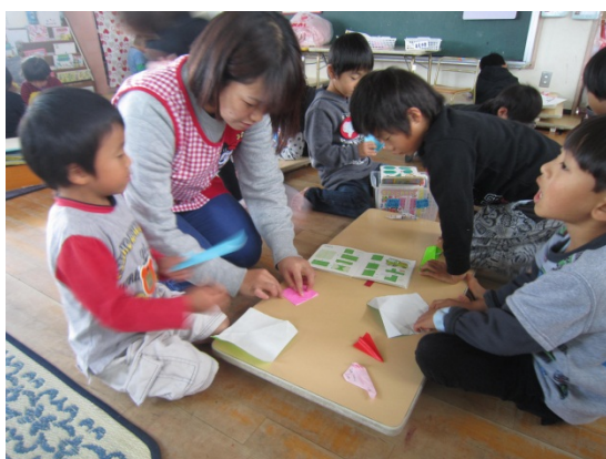
担任して保育指導する臨時職員