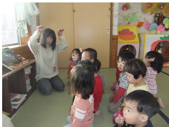
0・1・2歳児は途中入所が多く臨時職員で柔軟に対応