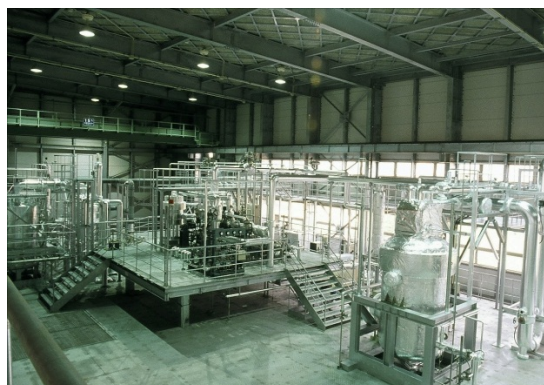
海洋温度差発電実験室の様子