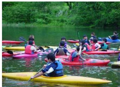
カヌー教室で体験活動を行う生徒たち