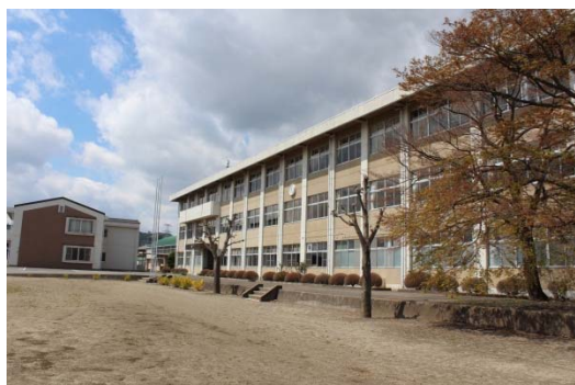
新たな第2校舎となる旧塩谷高等学校